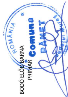
BODÓ ELŐD BARNA PRIMAR

* sub fiecare șef de structură se vor trece toate funcțiile publice și tot personalul contractual